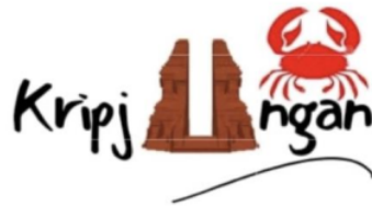
Gambar 2. Logo Kripjungan

UMKM Kripjungan adalah usaha mikro yang berlokasi di Kabupaten Cirebon, Jawa Barat, yang memproduksi kerupuk rajungan, salah satu komoditas hasil laut di wilayah