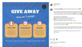
Gambar 5. Hasil Akhir

Untuk membuat konten lebih shareable, Kripjungan bisa menciptakan cerita yang kuat atau pesan yang relevan dengan audiens. Menggunakan strategi seperti giveaway atau konten dengan Call to Action (CTA) juga dapat mendorong audiens untuk membagikan konten, memperluas jangkauan merek secara alami.