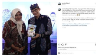
Gambar 4. Contoh Konten dengan tambahan caption

Meningkatkan kredibilitas konten dapat dilakukan dengan menambahkan informasi yang akurat dan terpercaya dalam setiap postingan. Kripjungan bisa menggunakan deskripsi yang jelas dan menyertakan testimoni atau pengalaman pengguna yang nyata untuk membangun kepercayaan audiens terhadap produk mereka.