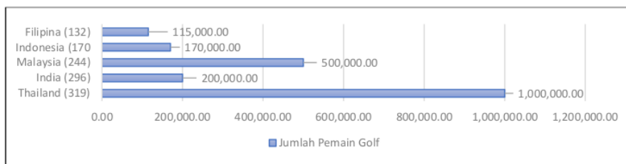
Gambar 1. Total Lapangan dan Jumlah Pemain Golf 5 Negara Asia

mengalami pertumbuhan besar hingga saat ini berkat keindahan alam, keragaman budaya, iklim yang mendukung dan lapangan golf kelas dunia yang dimiliki. Indonesia terus berupaya memberikan fasilitas terbaik dan lingkungan sekitar yang menakjubkan untuk menarik para penggemar golf domestik dan internasional. Namun, dibandingkan dengan destinasi golf yang sudah mapan seperti Thailand dan Malaysia, Indonesia masih merupakan pemain baru dalam industri pariwisata golf. Negara ini mengalami pertumbuhan jumlah wisatawan golf yang stabil, namun masih ada ruang untuk pengembangan lebih lanjut. Dilihat dari outlook industry golf , terjadi peningkatan pemain golf dunia yang dimulai sejak masa Covid-19 pada 2020 sebagai konsekuensi meminimalkan sentuhan fisik dan aktivitas di keramaian. Berdasarkan data laporan partisipasi Global Golf oleh R&A Grup tahun 2022, pertumbuhan pemain golf dunia meningkat 15% dari tahun 2020 hingga tahun 2022. Dan melesat 36% dari tahun 2016 ke tahun 2022. Jumlah lapangan golf yang tersedia harus diimbangi dengan jumlah pemain golf yang turut serta mengikuti wisata olahraga ini yang sasaran targetnya adalah kelas menengah ke atas. Berikut adalah data jumlah lapangan dan pemain di 5 negara di Asia menurut (CNBC Indonesia, 2024) :