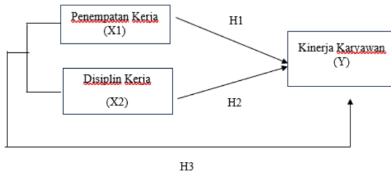
Gambar 1 Kerangka Berpikir