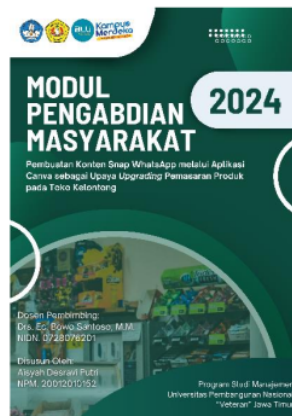
Gambar 2. Buku Panduan

Dari permasalahan yang telah ditemukan, penulis melanjutkan tahapan pendampingan ke tahapan selanjutnya yaitu pelaksanaan. Penulis membuat buku panduan mengenai cara mengedit melalui aplikasi canva yang didalamnya dapat mengedit berbagai konten seperti snap whatsapp, banner, logo toko dan lain sebagainya.