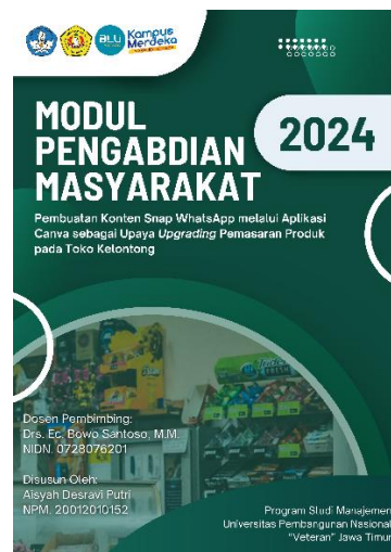
Gambar 2. Buku Panduan

Dari permasalahan yang telah ditemukan, penulis melanjutkan tahapan pendampingan ke tahapan selanjutnya yaitu pelaksanaan. Penulis membuat buku panduan mengenai cara mengedit melalui aplikasi canva yang didalamnya dapat mengedit berbagai konten seperti snap whatsapp, banner, logo toko dan lain sebagainya.