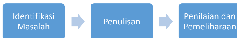
Gambar 1. Tahapan Pendampingan

Tahapan terakhir dari kegiatan pendampingan ini adalah penilaian dan pemeliharaan. Pada tahap ini, penulis akan menerima masukan, saran, kritik serta rekomendasi dari mitra mengenai program pendampingan yang telah terlaksana serta pemeliharaan output dari kegiatan pendampingan. Pemeliharaan dilakukan untuk mempertahankan atau bahkan meningkatkan kemampuan mitra dalam pemasaran.