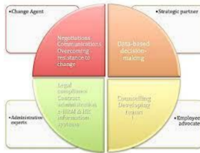
Gambar 1.4 Manajemen SDM

Namun, perubahan ini juga memunculkan sejumlah tantangan yang harus diatasi oleh manajemen SDM. Salah satu tantangan utama adalah adaptasi terhadap perubahan budaya dan perubahan dalam cara kerja yang disebabkan oleh adopsi teknologi baru (Kumar et al., 2019). Manajer SDM perlu memiliki keterampilan baru dalam analisis data, manajemen perubahan, dan kepemimpinan yang dapat memfasilitasi integrasi teknologi secara efektif dalam lingkungan kerja. Selain itu, masalah seperti perlindungan pekerja dalam ekonomi platform dan dampak sosial ekonomi dari digitalisasi membutuhkan perhatian lebih lanjut dalam pengembangan kebijakan yang adil dan berkelanjutan .