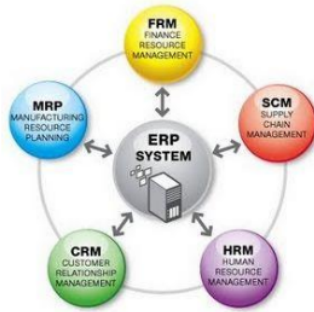
Gambar 1.1 Sistem SDM

Namun, tidak hanya aspek teknologi yang menjadi fokus utama dalam perencanaan SDM di era digital. Menurut Ahammad et al. (2018), keberhasilan perencanaan SDM juga bergantung pada kemampuan organisasi untuk mengidentifikasi dan mengembangkan kompetensi karyawan yang relevan dengan tuntutan pasar yang terus berubah. Hal ini menggarisbawahi pentingnya pendekatan holistik dalam pengembangan SDM, yang tidak hanya memperhitungkan aspek teknologi, tetapi juga faktor-faktor manusiawi seperti kebutuhan keterampilan dan motivasi karyawan.